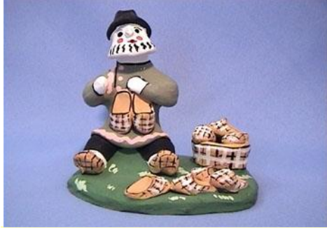
Игрушка - свистулька