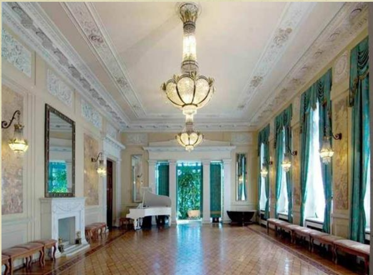
Белый зал и выход в оранжерею